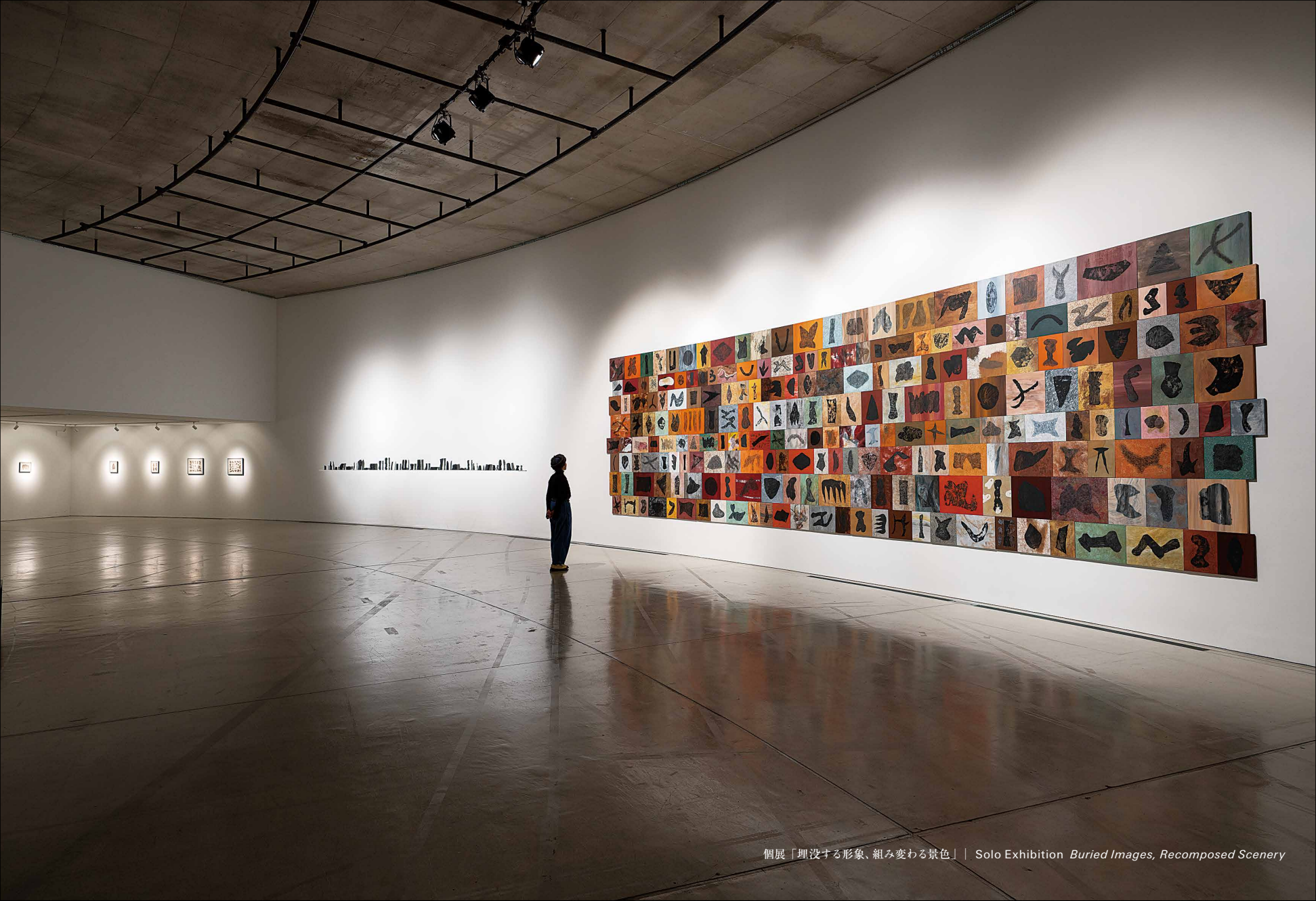
個展「埋没する形象、組み変わる景色」 | Solo Exhibition Buried Images, Recomposed Scenery